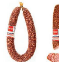
Колбаса сыровяленая "Бургундская"