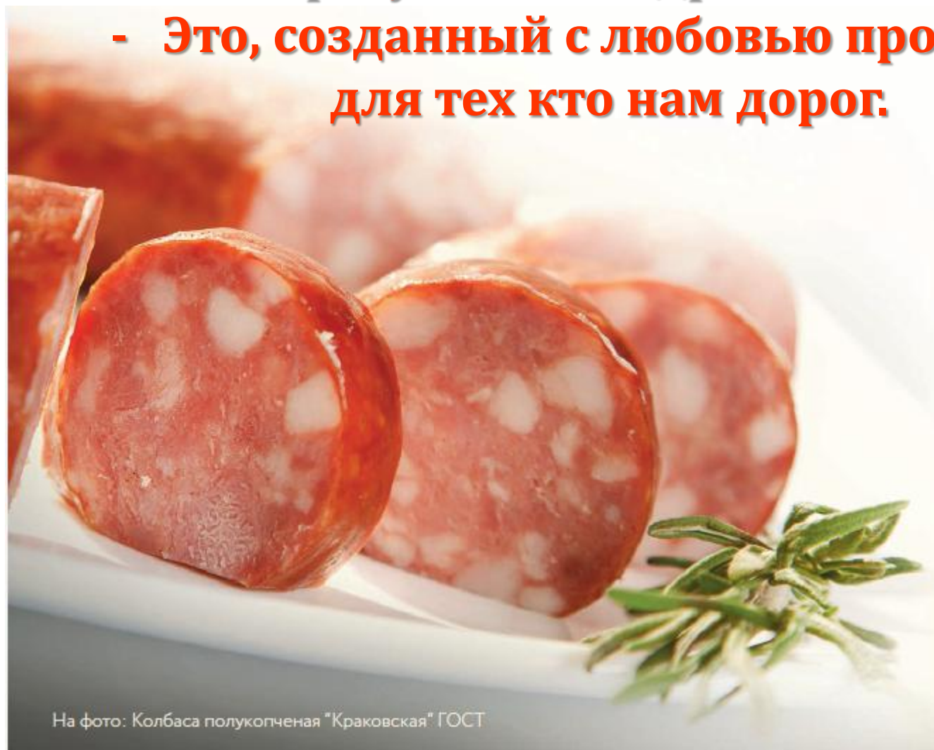
На фото: Колбаса полукопченая "Краковская" ГОСТ